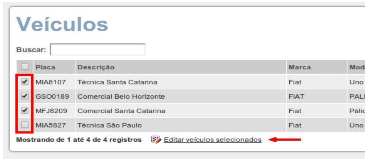
Figura 4: Seleção de veículos para edição em lote.

Este tipo de edição facilita a alteração de controles que são comuns a muitos veículos, sendo assim será permitida a alteração apenas dos seguintes campos: